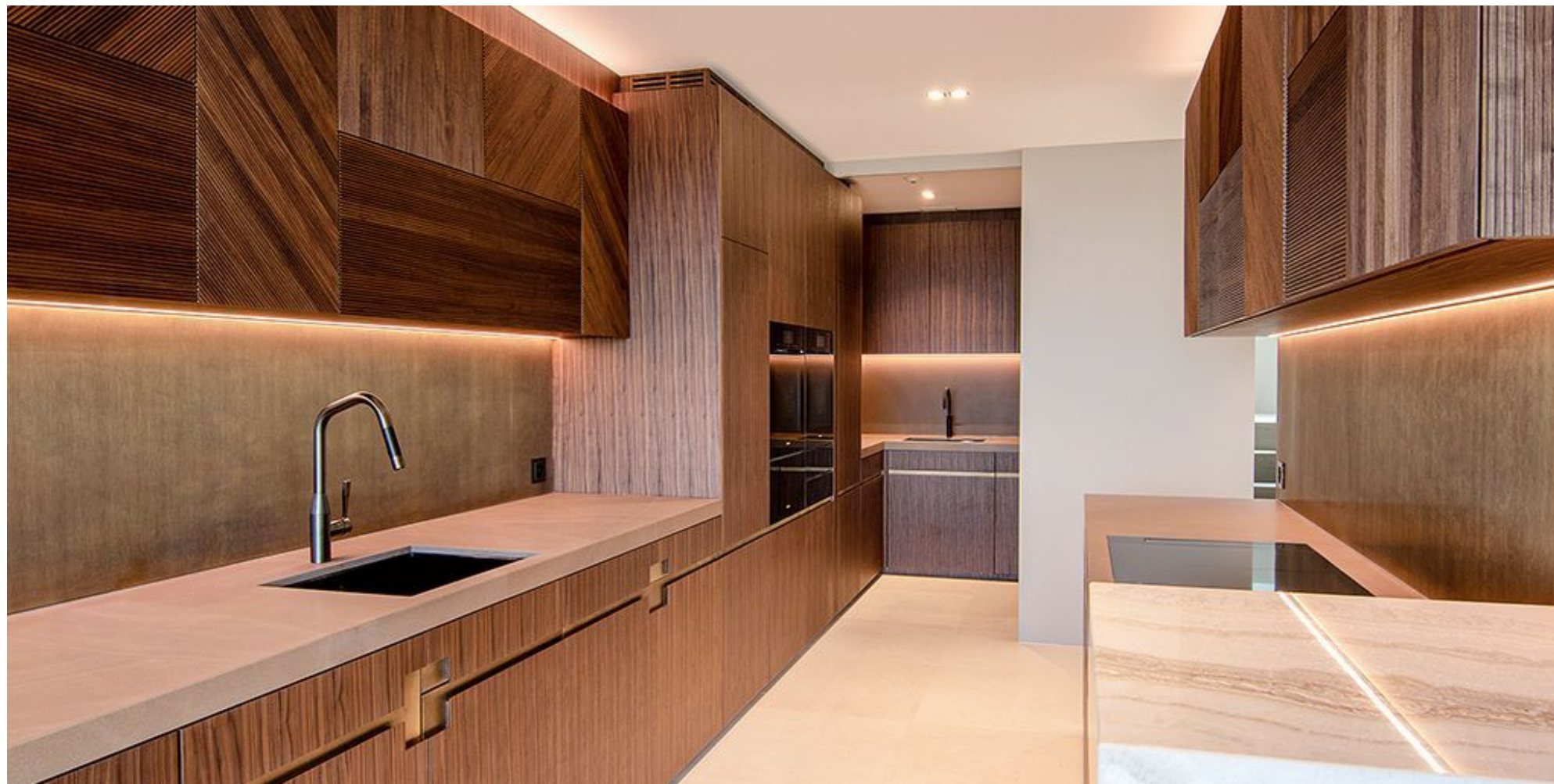
Gewinner-Küche des Jury-Awards 2019: Das Projekt Criss-Cross von der Schreinerei Itel AG.

Küche Schweiz. Ab heute können sich Schreinerinnen und Schreiner für den begehrten Swiss Kitchen Award bewerben. Bereits zum fünften Mal werden in den Kategorien «Schönste Küche der Schweiz» und «Bester Küchenumbau der Schweiz» herausragende Projekte gesucht.