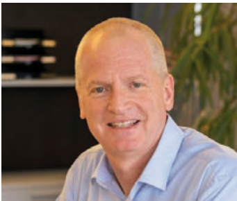
Roland Felder CEO/Delegierter des VR ANWR- GARANT SWISS AG & Aufsichtsrat SPORT 2000 International