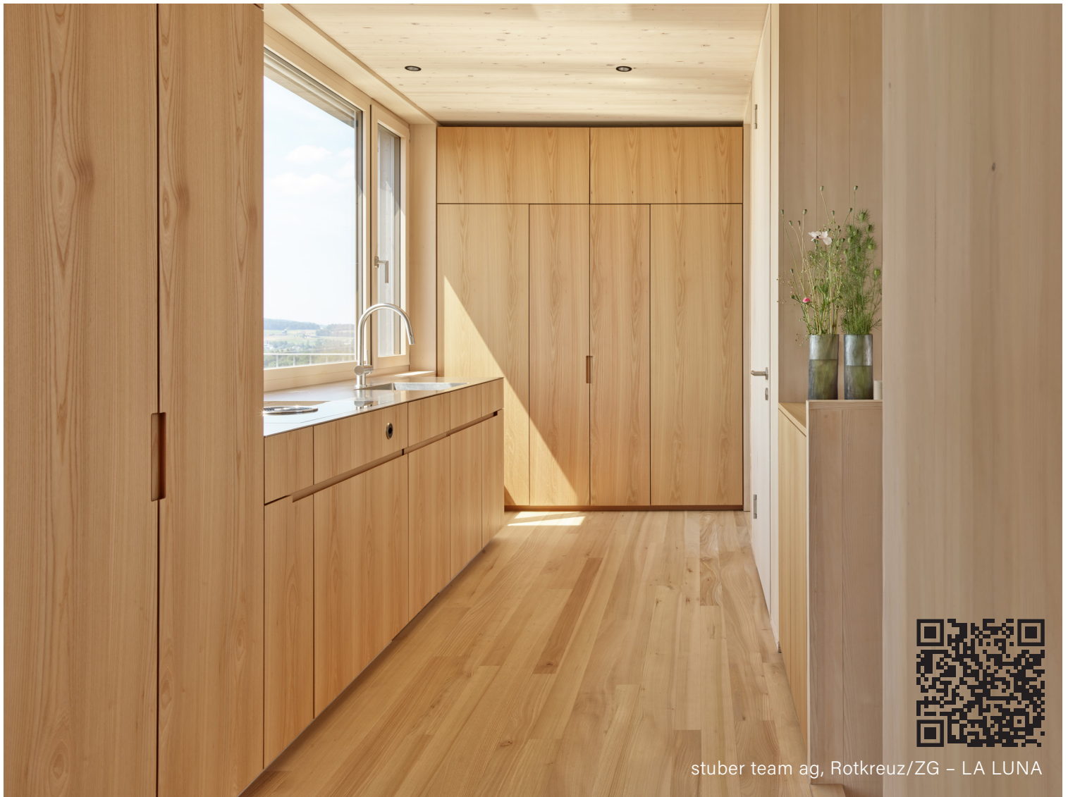
stuber team ag, Rotkreuz/ZG - LA LUNA