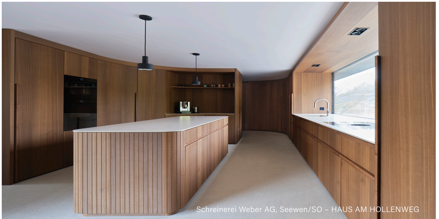
Schreinerei Weber AG, Seewen/SO – HAUS AM HOLLENWEG