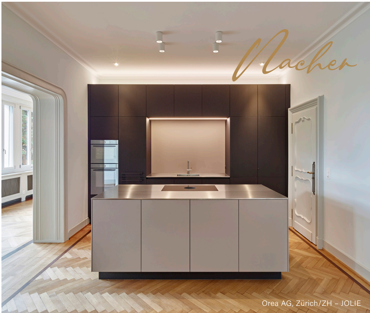
Orea AG, Zürich/ZH - JOLIE