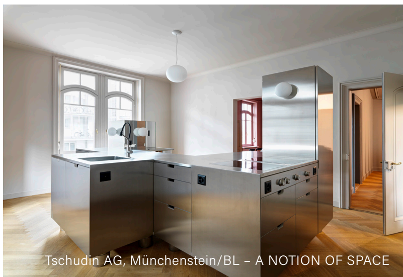
Tschudin AG, Münchenstein/BL - A NOTION OF SPACE