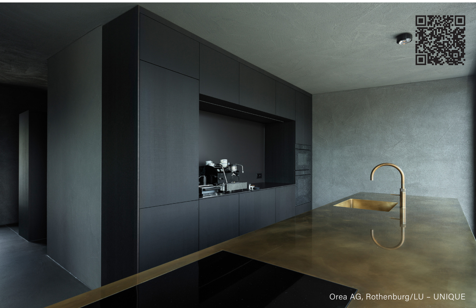
Orea AG, Rothenburg/LU - UNIQUE