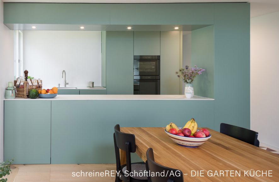
schreineREY, Schöffland/AG – DIE GARTEN KÜCHE