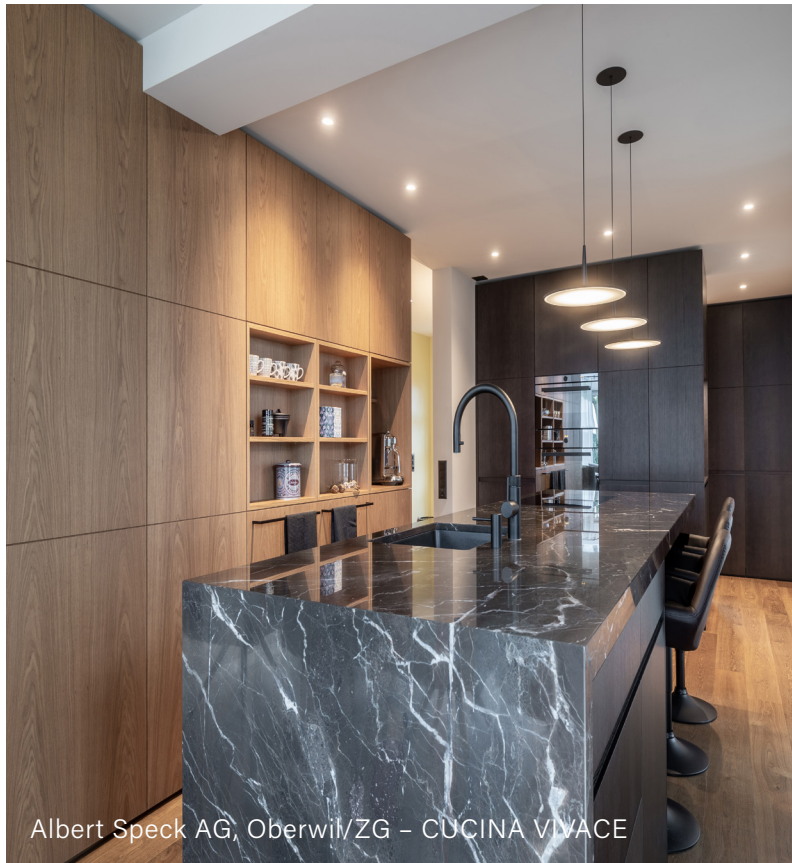
Albert Speck AG, Oberwil/ZG – CUCINA VIVACE