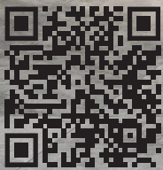
Bureau Hindermann GmbH, Zürich/ZH - LA CATRINA