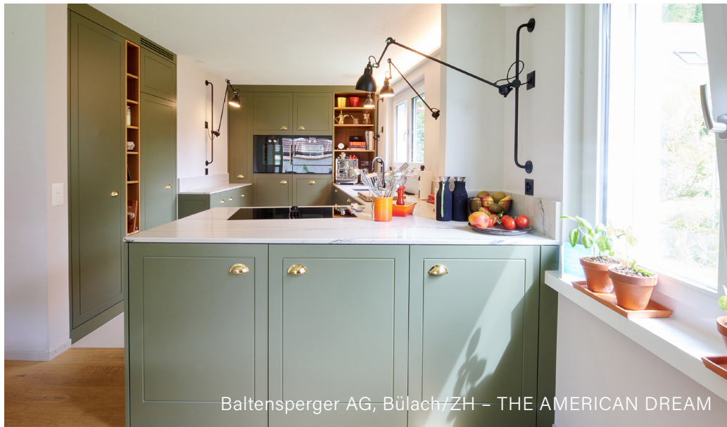
Baltensperger AG, Bülach/ZH – THE AMERICAN DREAM