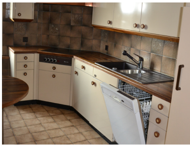
Domus Leuchten und Möbel AG, St.Gallen/SG – ZWEI-WELTEN-EIN-RAUM