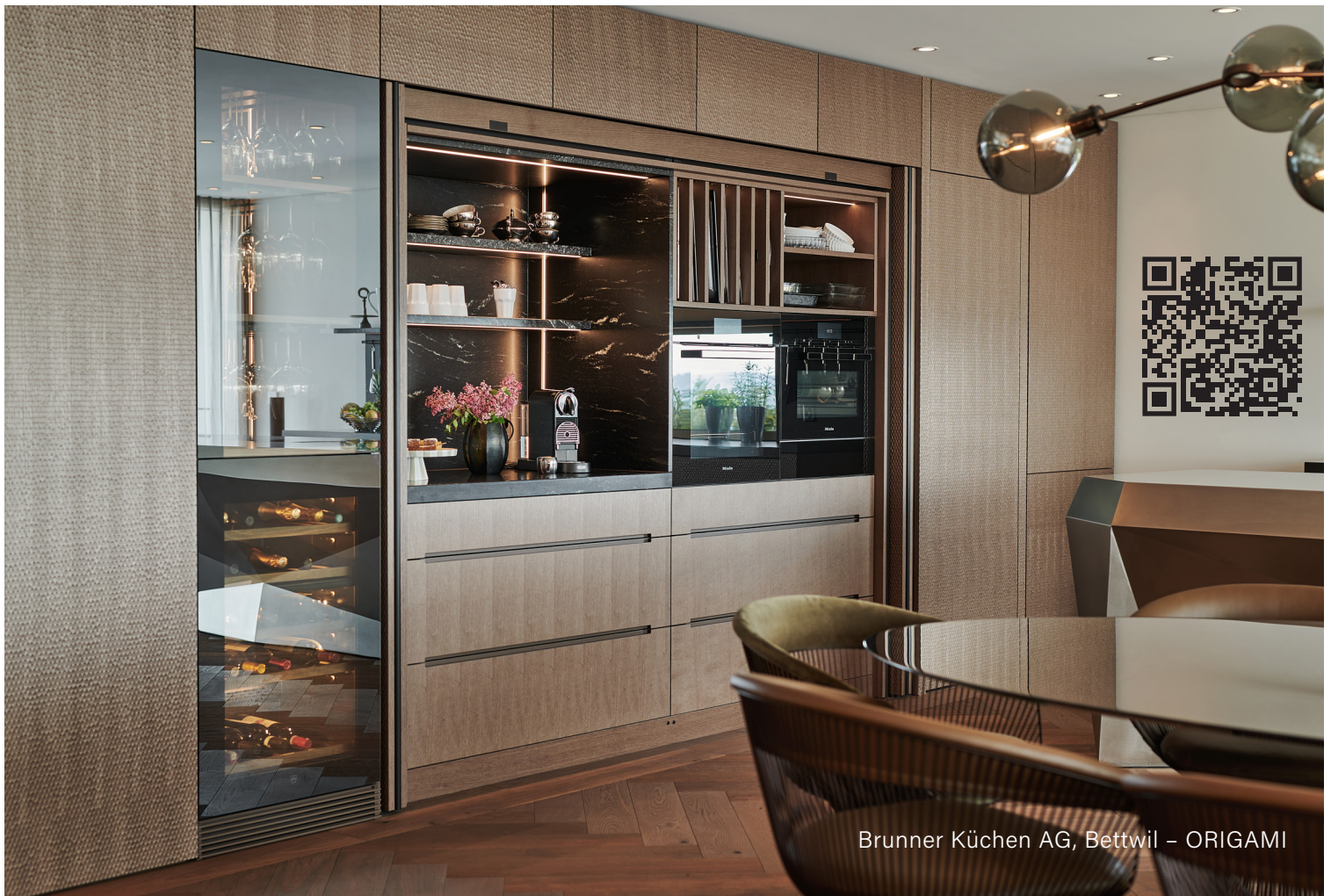
Brunner Küchen AG, Bettwil - ORIGAMI