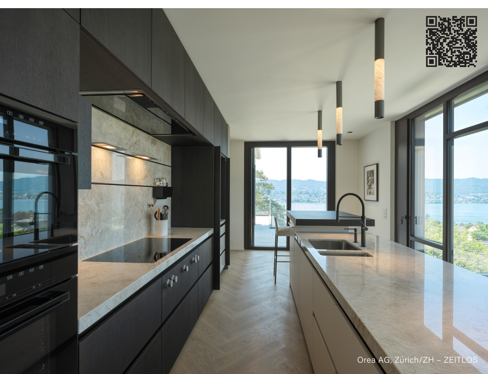
Orea AG, Zürich/ZH - ZEITLOS