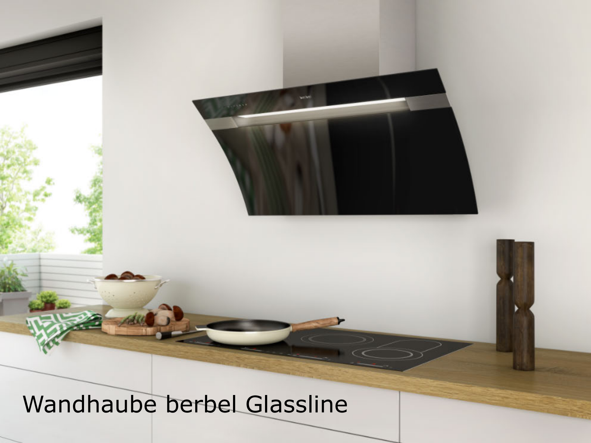
Wandhaube berbel Glassline