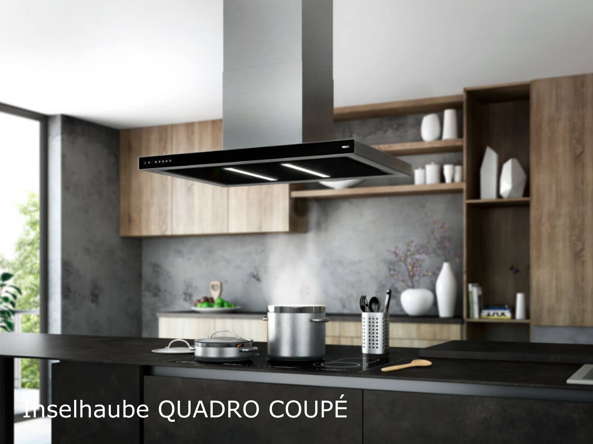
Inselhaube QUADRO COUPÉ