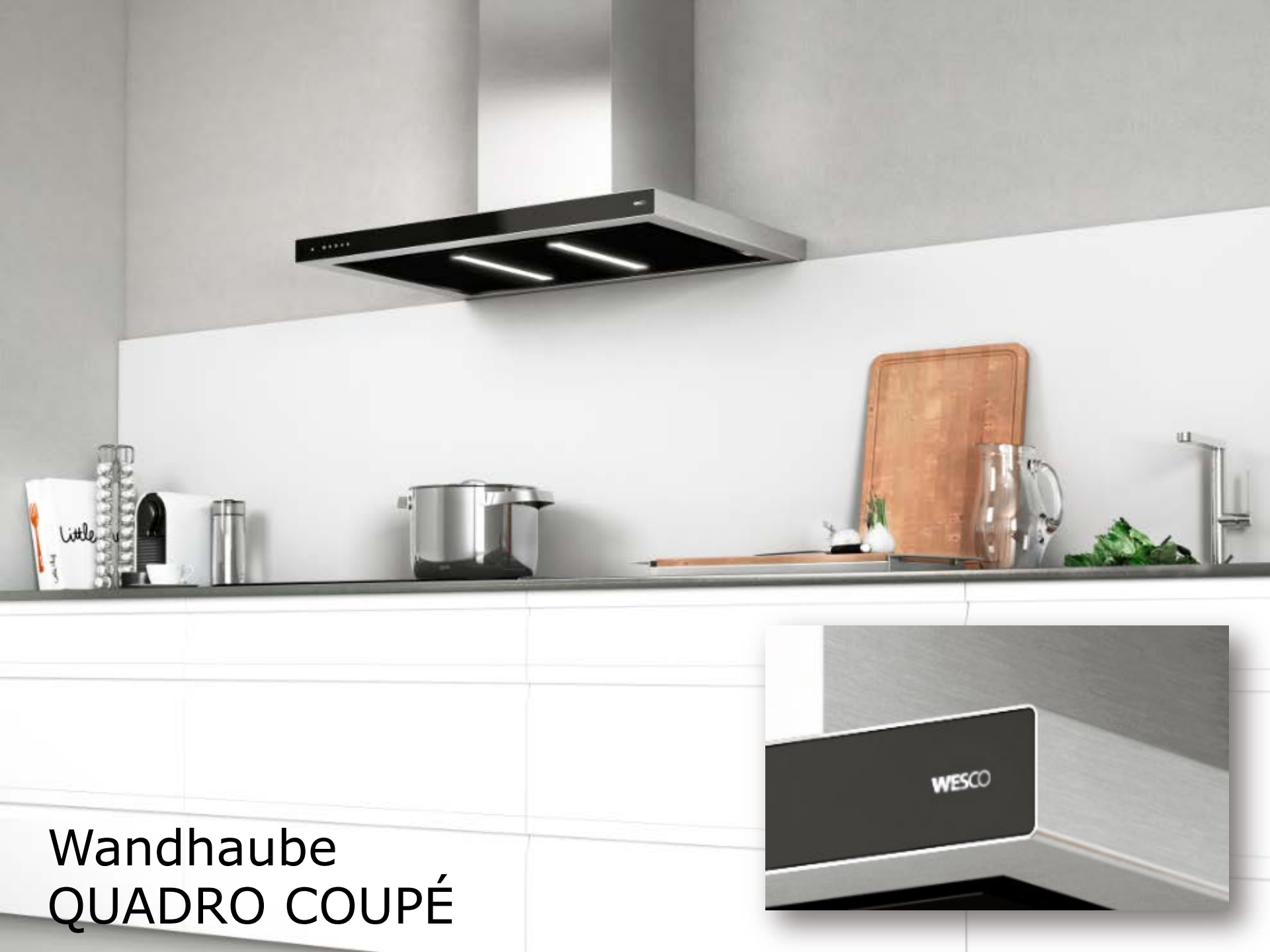
Wandhaube QUADRO COUPÉ