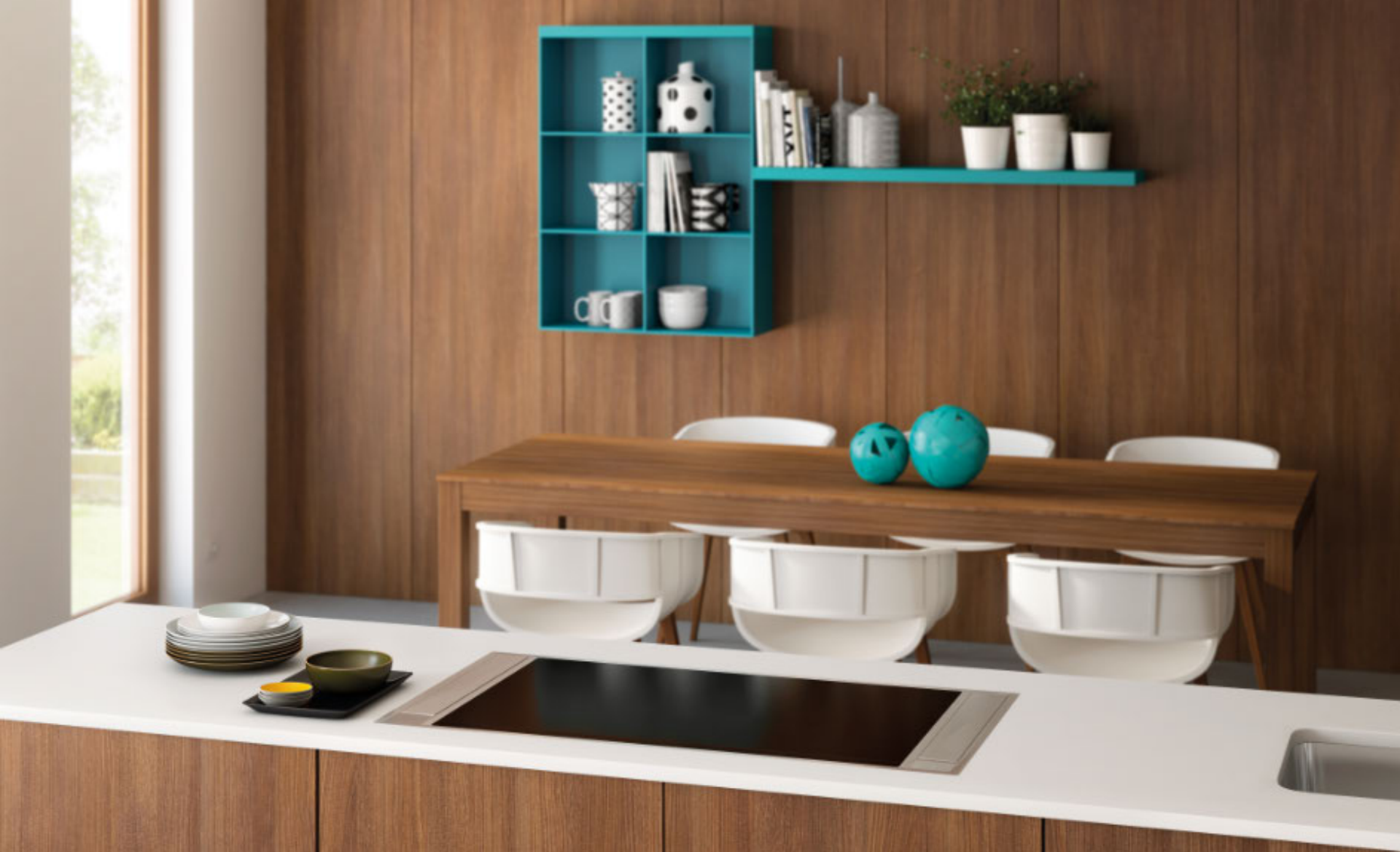
Muldenlüfter BASSO – seitliche Absaugung