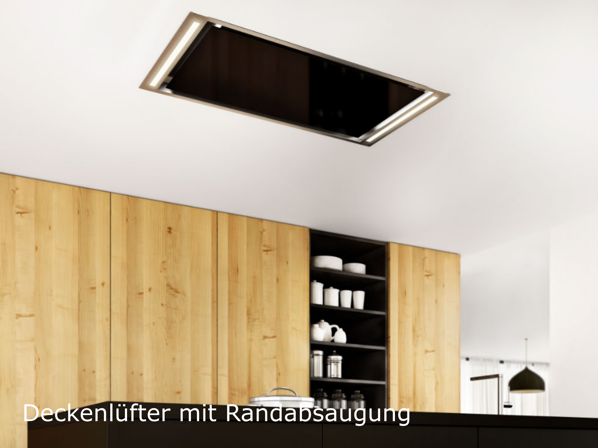
Deckenlüfter mit Randabsaugung