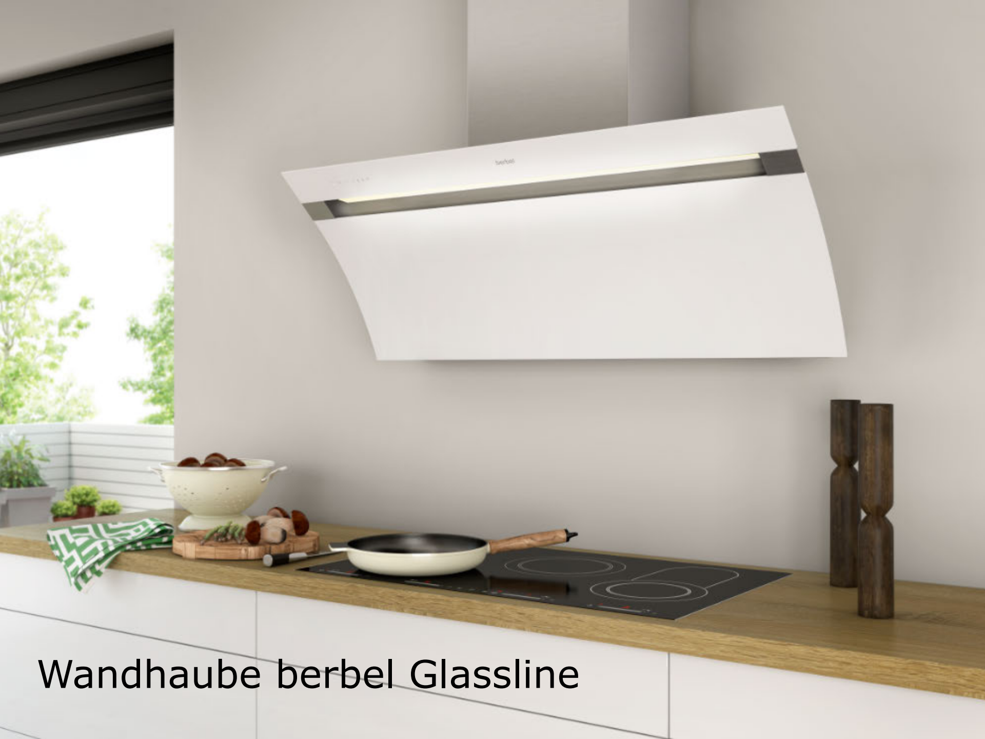
Wandhaube berbel Glassline