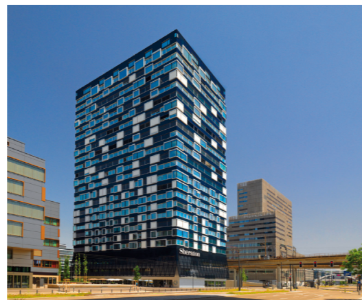
Sheraton Zürich Hotel Pfingstweidstrasse 100, 8005 Zürich www.sheratonzurichhotel.com